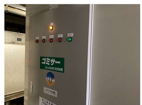
排水汚泥消滅機（ゴミサー）