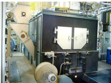
バイオマスボイラー1号機