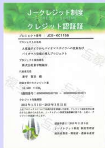
J-Credit認証を取得しました

バイオマスボイラー導入後カーボンリサイクルによりCO 2 の排出は大幅に減少しました。また夏季のピークカットの為に発電機を活用し、購入電力量の抑制に努めています。