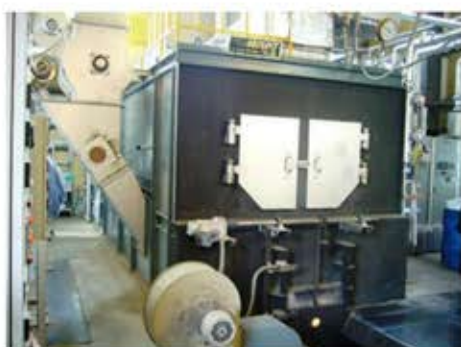
バイオマスボイラー1号機